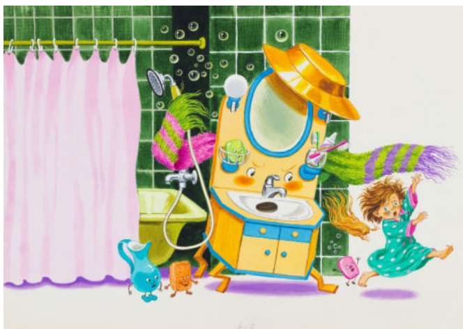
(К.И. Чуковский «Мойдодыр»)

Сел Андрей и поднял ногу, Языком лизнул башмак... Ну, теперь пора в дорогу, Можно сделать первый шаг!