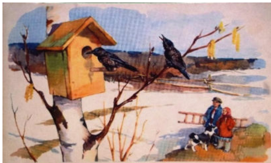
(А.Л.Барто «Скворцы прилетели»)

Мы сегодня встали рано, Ждали птиц ещё вчера. Ходит по двору охрана, Гонит кошек со двора.