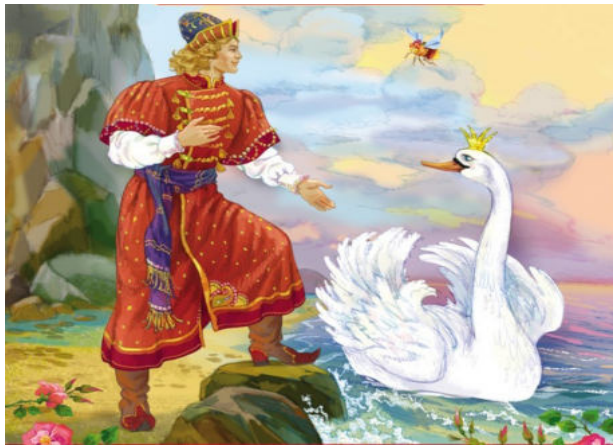
(А.С.Пушкин «Сказка о царе Салтане»)